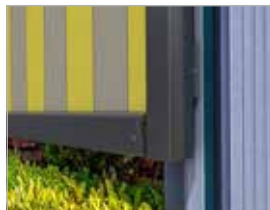
Filigran, schlanke Führungsschienen und stabiles Ausfallprofil, schließen vorne bündig ab.