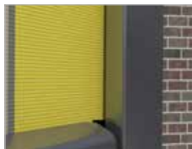
Geschlossene Optik durch das tracfix System (optional) – ohne störenden Spalt zwischen Tuch und Führungsschiene.

Die Führung des Markisentuches erfolgt durch stabile Führungsschienen aus Aluminium und die 85 mm starke Tuchwelle sorgt auch bei großen Flächen für hohe Stabilität und ein optimales Wickelverhalten des Markisentuches.