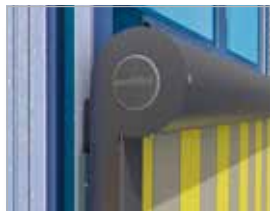
Seitenansicht markilux 869

Die Markise ist dadurch besonders windstabil. Größenabhängig bis Windwiderstandsklasse 3 (Windstärke 6). Auch größere Flächen bieten mit Windwiderstandsklasse 2 (Windstärke 5) noch einen sicheren Komfort. Spezielle Variogurte sorgen für eine optimale Tuchspannung bei komplett ausgefahrener Markise.